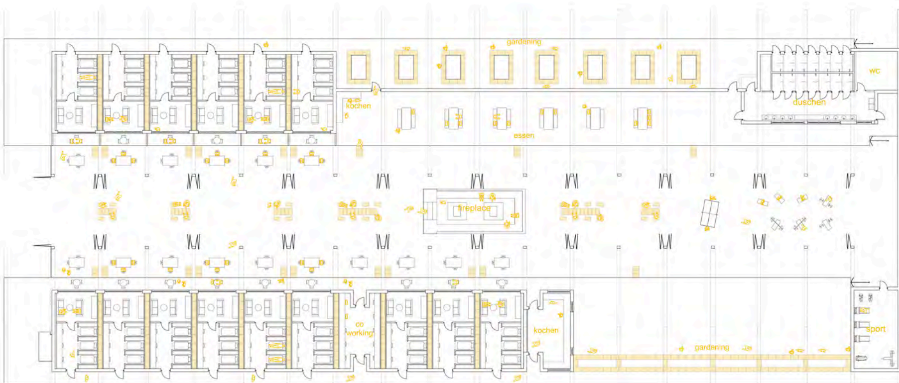
Grundrissgestaltung im Sommer (links) und im Winter (rechts) Feuerstelle im Frühjahr (oben) © Ilkan Akcagliyan | Jasmin Drutjans

Bauen mit Stroh ist bei dieser Arbeit der zentrale Aspekt. Strowände, die in der kalten Jahreszeit als Isolierung und Rauntrennung dienen, können in den Sommermonaten auseinander- und als Möbel und Beete wieder aufgebaut werden. In die Planung einbezogen wird der Innenhof rund um eine zentrale Feuerstelle.